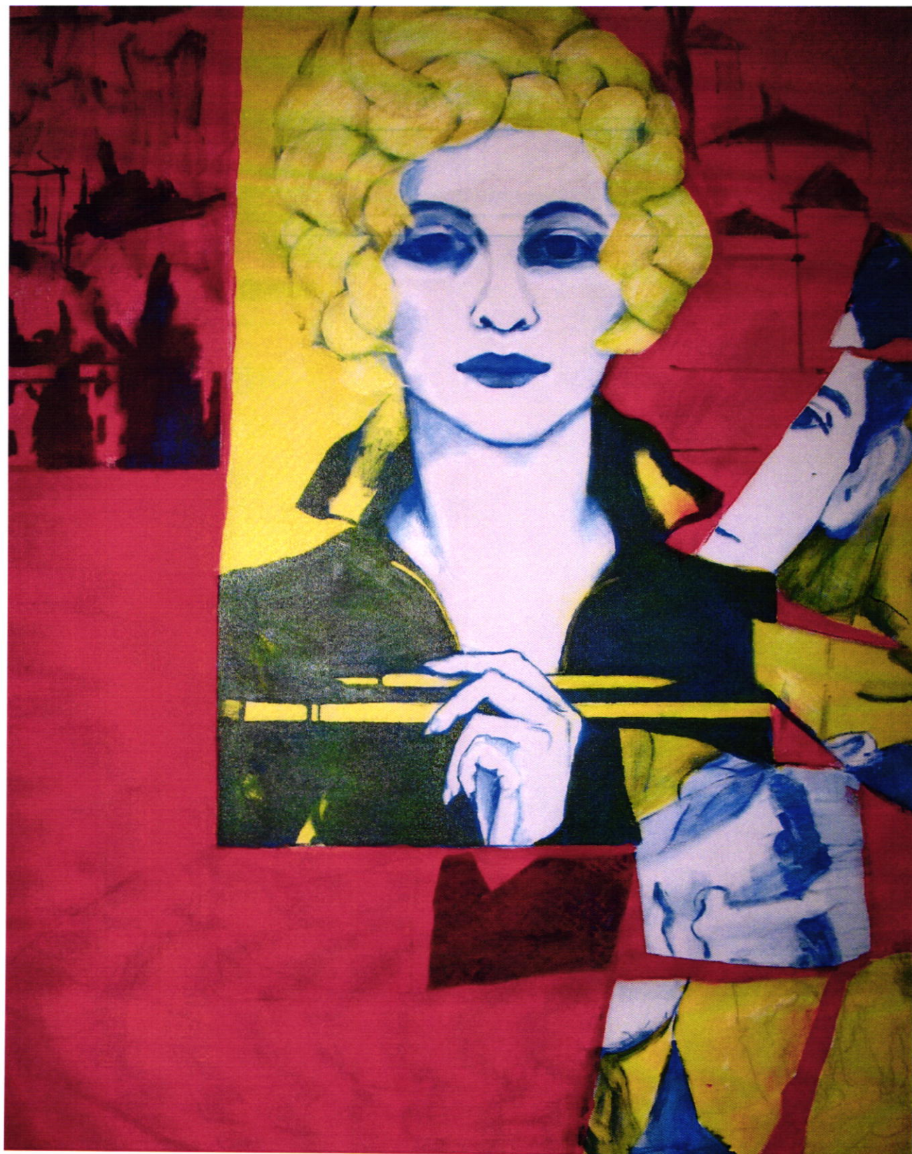
— Magdaléna Serbáková Vtáctvo, Madarak, 2017 akryl 80x60.jpg —